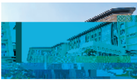
中国教玩具国际城正对桥下教玩具产业强链补链

一手改存量，一手抓增量。永嘉近3个月内梳理出近期可用工业用地超3000亩，确保“地等项目”；上半年计划出让600亩，并以产城融合思路吸引先进制造业集聚发展。不久前，一则“永嘉与中国金茂集团签约，携手打造超350亿元温州北外滩项目”的消息，刷爆了温州人的朋友圈。这片土地，也迎来了更多人的另眼相看。永嘉还是