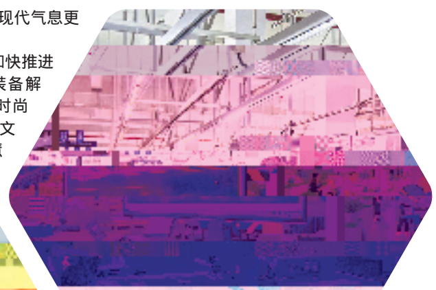
大力引进数字化改造的报喜鸟集团生产车间