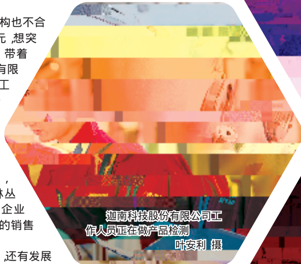
迦南科技股份有限公司工作人员正在做产品检测

系列组合拳之下，永嘉加快推进单一泵阀装备向成套流体装备解决方案、鞋服和纽扣拉链向时尚智造、教玩具向教育装备及文化创意转变，数字经济、智慧物流、生命健康等新兴产业